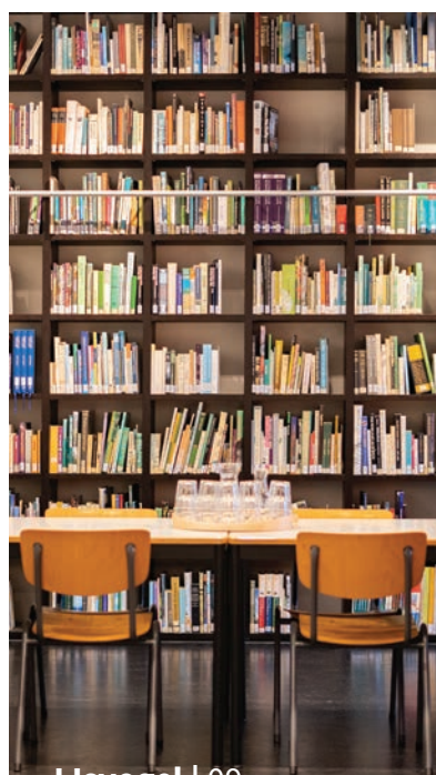
IJsvogel | 09